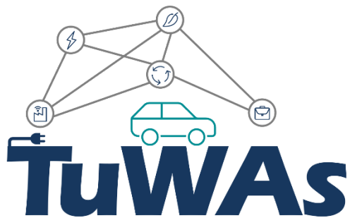
Abb. 1 »TuWAs«, Transformations-Hub für umformtechnische Wertschöpfungsketten im Antriebsstrang