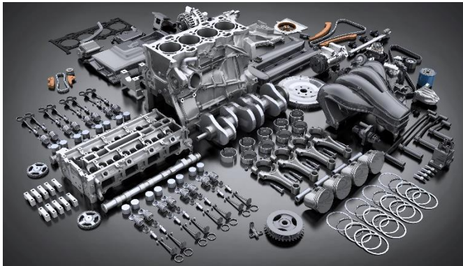
Abb. 2 Ein Verbrennungsmotor besteht in der Regel aus über 1 000 Teilen und benötigt für die Kraftübertragung ein komplexes Getriebe www.iwu.fraunhofer.de